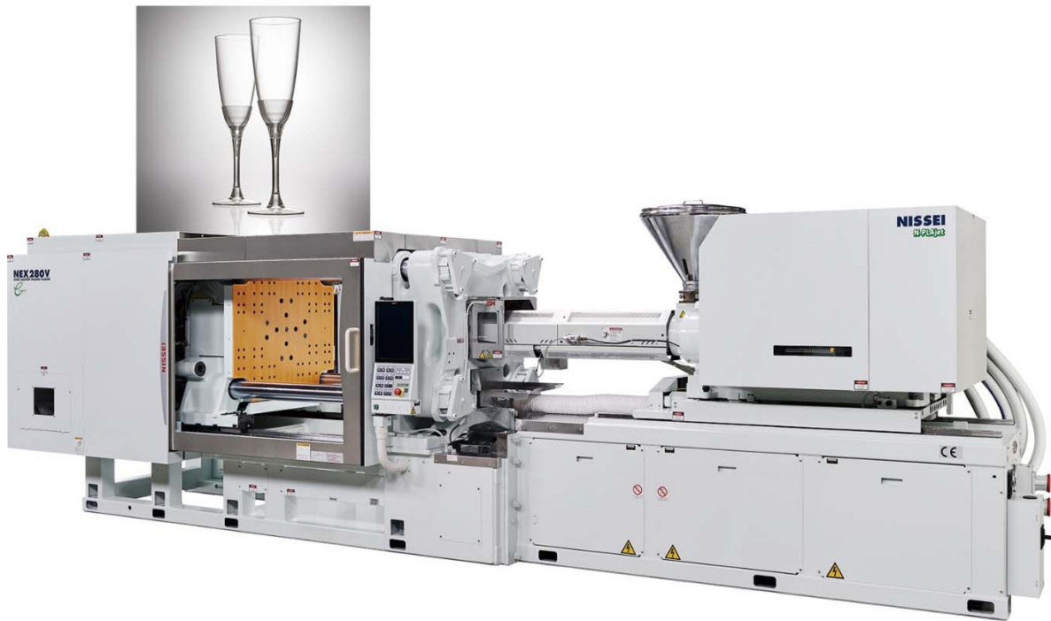
▲薄肉透明用途（シャンパングラス）